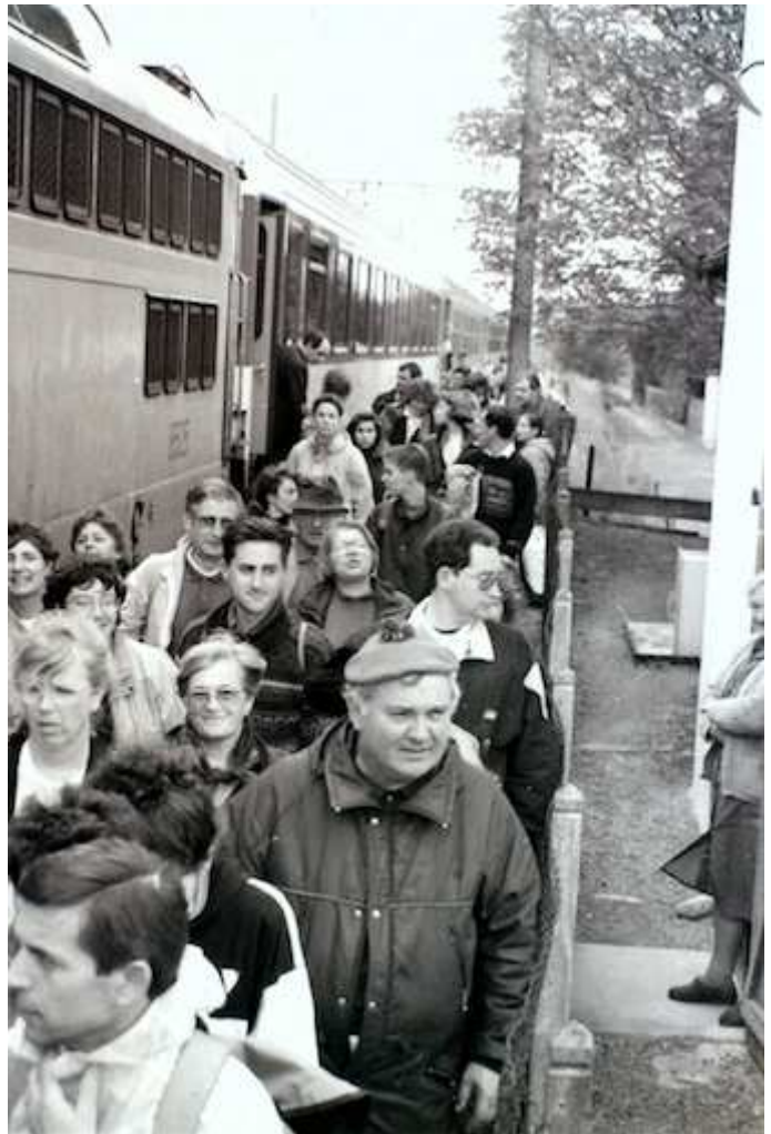
Arrivée du train à l'ancienne gare de Boeil -Bezing

Lorsqu'il y avait trop d'inscrits, un train spécial était affrété pour ramener tous les fidèles, jusqu'à l'ancienne gare de Boeil- Bezing.